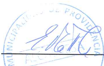
D. EVELYN MATTHEI FORNET ALCALDESA MUNICIPALIDAD DE PROVIDENCIA

DECIMO CUARTO: El presente convenio se firma en 2 ejemplares, quedando uno en poder del Servicio de Salud y el otro en la Municipalidad.